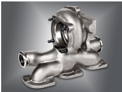
Abgaskrümmer mit Turbinengehäuse

Ni-Resist-Werkstoffe sind hochlegierte austenitische Gusseisensorten mit Kugel- (und in Spezialfällen Lamellen-) graphit, die zu mehr als 25% (Massenprozent) nicht aus Eisen bestehen. Es handelt sich um hochlegierte Werkstoffe, vergleichbar den Edelstählen. Der Handelsname Ni-Resist basiert auf einem Nickelgehalt von mehr als 20%, der das austenitische Grundgefüge sicherstellt. Ni-Resist-Gusseisen weisen eine Reihe besonderer Eigenschaften auf, die sie für eine Vielfalt von Anwendungen interessant machen: Korrosionsbeständigkeit gegen Meerwasser und alkalische Medien, Zunderbeständigkeit, hohe Warmfestigkeit, Temperaturwechselbeständigkeit, hohe Duktilität (Bruchdehnung), Verschleiß- und Erosionsbeständigkeit, Nichtmagnetisierbarkeit und hohe (EN-GJSA-XNiCr 20-2, Handelsname: D2) bzw. niedrige (EN-GJSA-XNiSiCr 35-5-2, Handelsname: D5) thermische Ausdehnungskoeffizienten. Ni-Resist steht im Wettbewerb zu nicht-rostenden, hitzebeständigen Stählen, gegenüber denen sie fertigungstechnische Vorteile haben und damit eine kostengünstige Alternative darstellen.