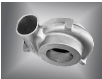
Turbinengehäuse für Abgasturbolader