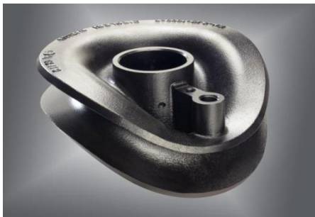
Kurvenscheibe einer Landmaschine