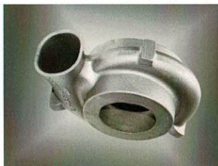
Carter de turbine pour turbocompresseurs