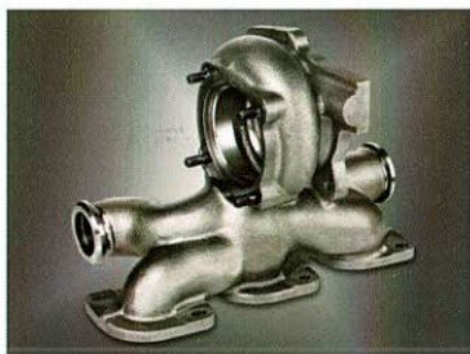
Tubulure d'échappement avec carter de turbo

Les nuances Ni-Résist sont des types de fontes sphéroïdales austénitiques hautement alliées (et pour des cas particuliers des fontes lamellaires), qui ne contiennent pas plus de 25% (teneur massique) d'acier. Il s'agit d'un matériau hautement allié, comparables aux aciers inoxydables. Le nom commercial Ni-Résist est basé sur une teneur en nickel de plus de 20%, ce qui assure une structure de base austénitique. Les fontes Ni-Résist possèdent des propriétés spécifiques, qui les rendent intéressantes pour un grand nombre d'utilisations: Résistance à la corrosion à l'eau de mer et milieux alcalins, résistance à l'oxydation, résistance à hautes températures, résistance aux variations de températures, haute ductilité, (Allongement proportionnel à la limite élastique), résistance à l'usure, à l'érosion, amagnétique, et un coefficient de dilatation thermique soit haut (EN-GJSA-XNiCr 20-2, Nom commercial: D2), soit faible (EN-GJSA-XNiSiCr 35-5-2, Nom commercial: D5). Les Ni-Resist représentent une alternative compétitive aux aciers inoxydables thermiquement stables; cependant, comparativement à de tels aciers, les nuances de Ni-Resist ont des coûts de production moins élevés.